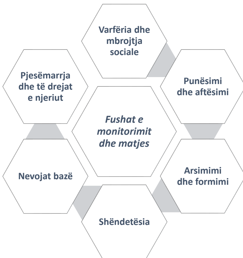
Figura 2: Fushat e politikave publike për monitorimin dhe matjen e përfshirjes sociale