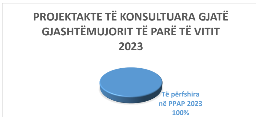
Fig.2: Projektakte të konsultuara gjatë gjashtëmuorit të parë të vitit 2023, sipas përfshirjes në PPAP

Gjatë gjashtëmuorit të parë të vitit 2023, i janë nënshtruar konsultimit publik 3 (tre) projektligje, konkretisht projektligji “Për disa shtesa dhe ndryshime në ligjin nr.80/2020 ‘Për policinë e burgjeve’”, projektligji “Për arbitrazhin në Republikën e Shqipërisë”, projektligji “Për një shtesë në ligjin nr.7905, datë 21.3.1995, “Kodi procedurës penale i republikës së shqipërisë”, të ndryshuar”.