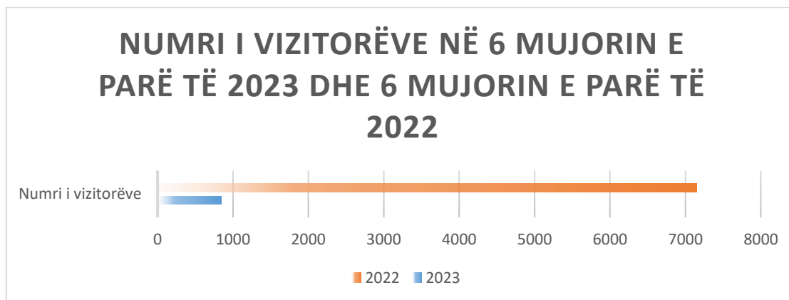
Fig 4: Krahasim i numrit të vizitorëve të RENJK në gjashtë mujorin e parë të 2023 dhe 2022

Të dhënat e përftuara nga Regjistri Elektronik për Njoftimet dhe Konsultimet Publike tregojnë se është ulur numri i vizitorëve përkatësisht 844 për gjashtë mujorin e parë të vitit 2023, ndërsa për gjashtë mujorin e parë të vitit 2022 numri ka qenë 7153. Gjatë gjashtë mujorit të parë të vitit 2023 vihet re një interes më i ulët në lidhje me komentet e përcjella përmes platformës së regjistrimit elektronik.