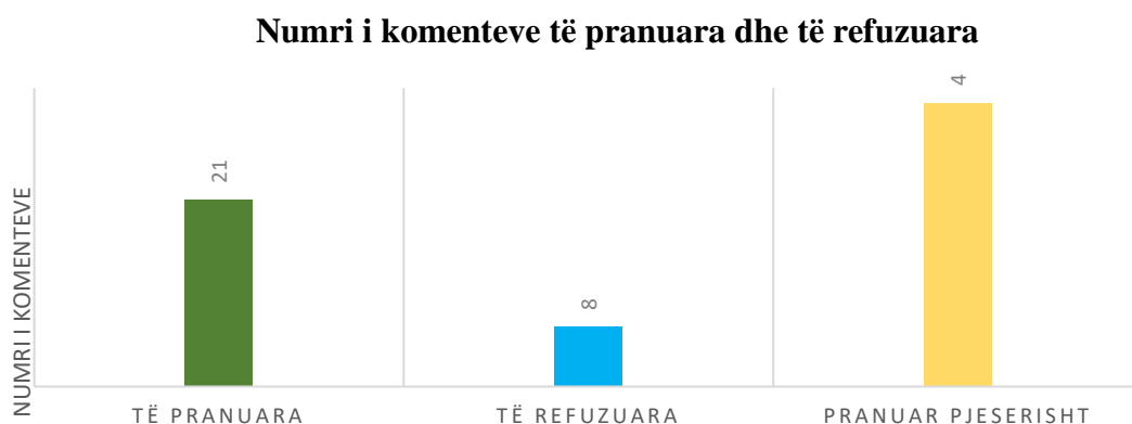
Fig. : Numri i komenteve të pranuar dhe refuzuara

2.5.3 Cila është tendenca nëse krahasohet me vitet e kaluara?